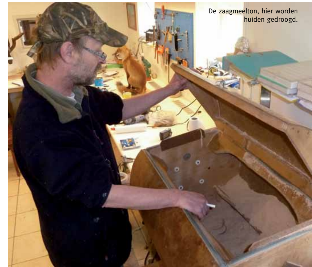
De zaagmeelton, hier worden huiden gedroogd.