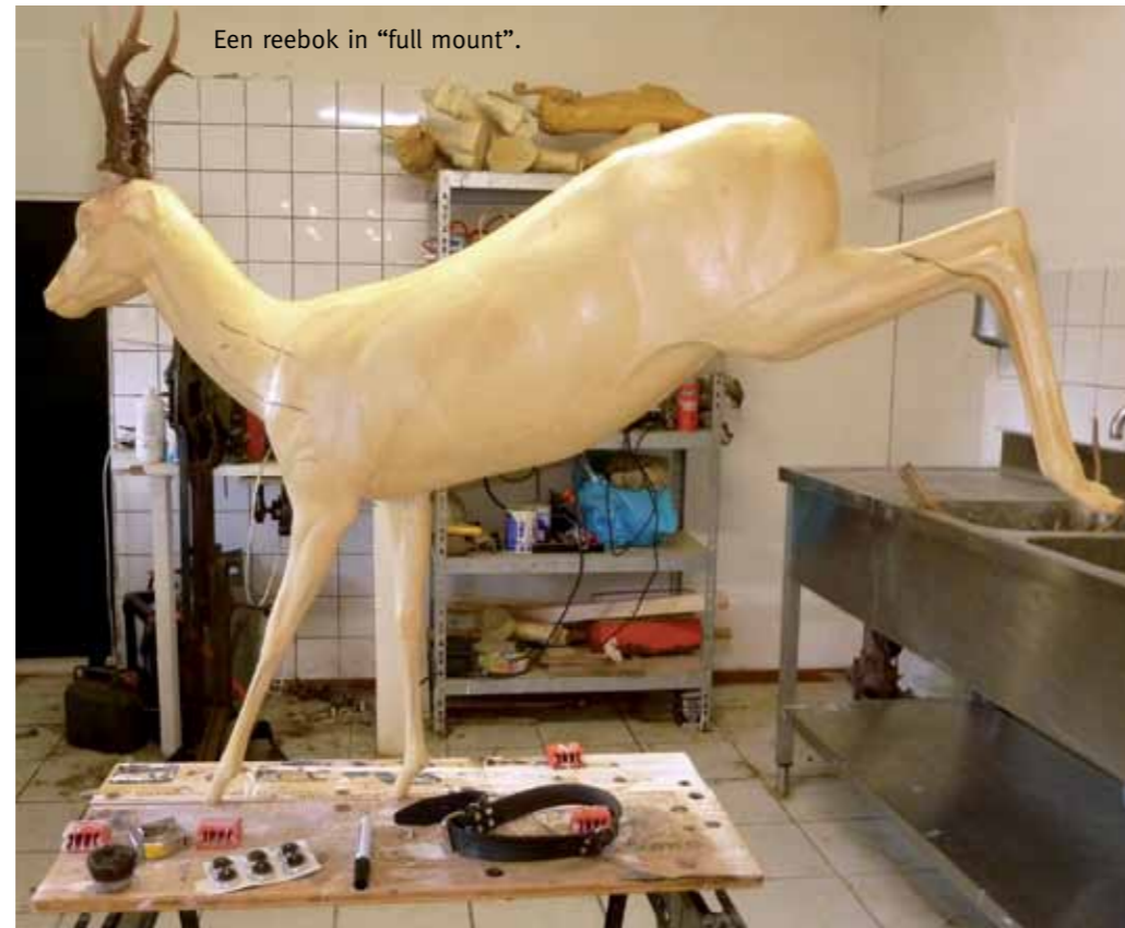
Een reebok in "full mount".

aluin. Vervolgens kies ik een polystyreen model en na het centrifugeren van de huid prepareer ik het geheel met watten en pinnetjes. Het geheel moet daarna 2 tot 3 maanden drogen.