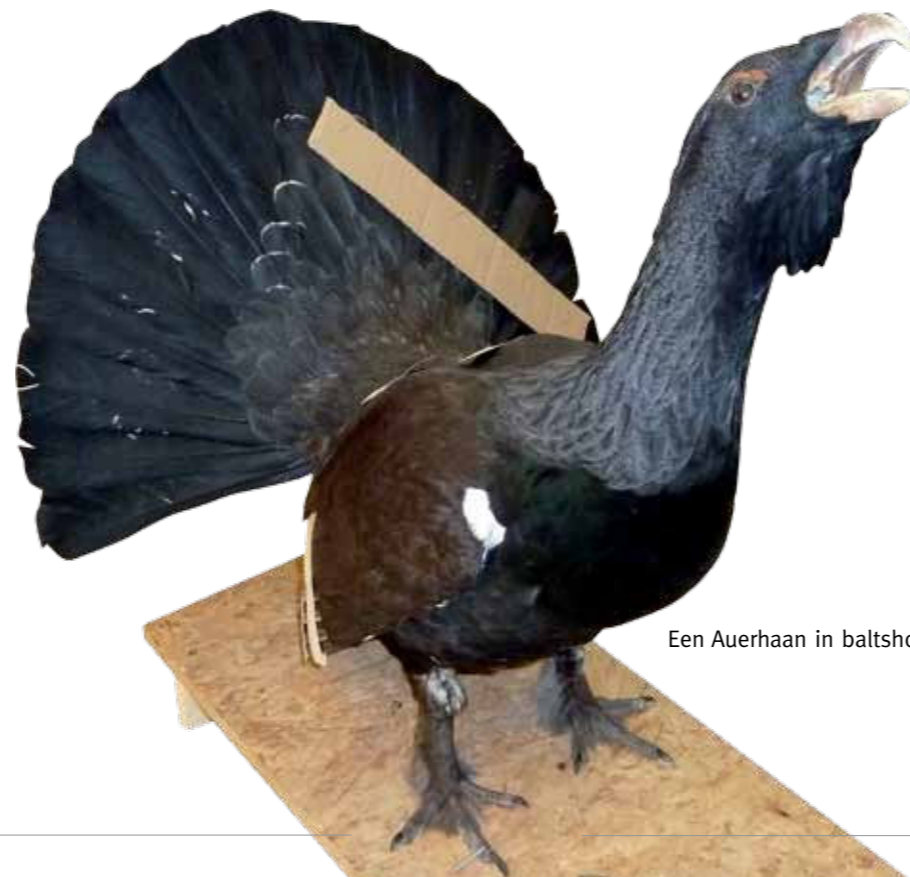
Een Auerhaan in baltshouding.

de kop, en als het kan met een klein kaliber: .222 of .223. Zelf ontweiden, de huid eraf halen of hem helemaal invriezen en zo bij mij aanleveren. Als je zelf de huid eraf wilt halen moet je goed weten wat je doet; het is best een klus. Wanneer je zo ver komt: de huid aan de binnenkant goed schoon schrapen en dan veel zout