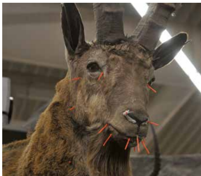
Oog voor detail.

wanneer je in de neus kijkt, dan moet het ook kloppen. Kijk je naar een trofee, dan neem je ongemerkt meer waar dan je denkt. De neus speelt daarbij een grote rol. Zelfs als je er met een lampje in schijnt, dan kloppen mijn neuzen tot zover je kunt kijken. Onze neuzen zijn niet dichtgesmeerd. Maar ook zaken als de oogleden zijn belangrijk. Sommige dieren, zoals honden en katten, hebben een derde ooglid, het knipvlies. Zoiets is een essentieel onderdeel, want als het er niet is, dan heb je al snel het idee