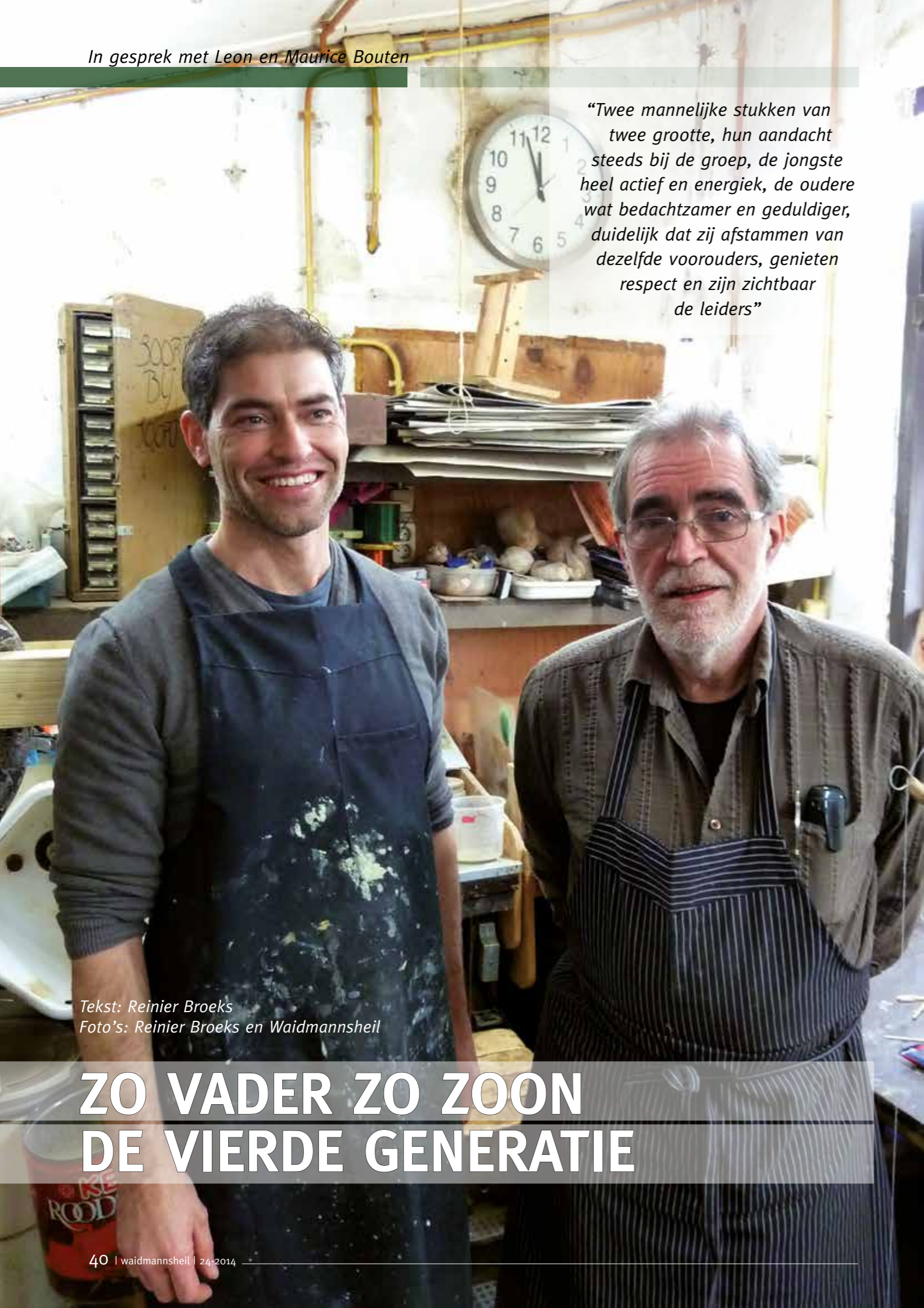
Tekst: Reinier Broeks

“Twee mannelijke stukken van twee grootte, hun aandacht steeds bij de groep, de jongste heel actief en energiek, de oudere wat bedachtzamer en geduldiger, duidelijk dat zij afstammen van dezelfde voorouders, genieten respect en zijn zichtbaar de leiders”