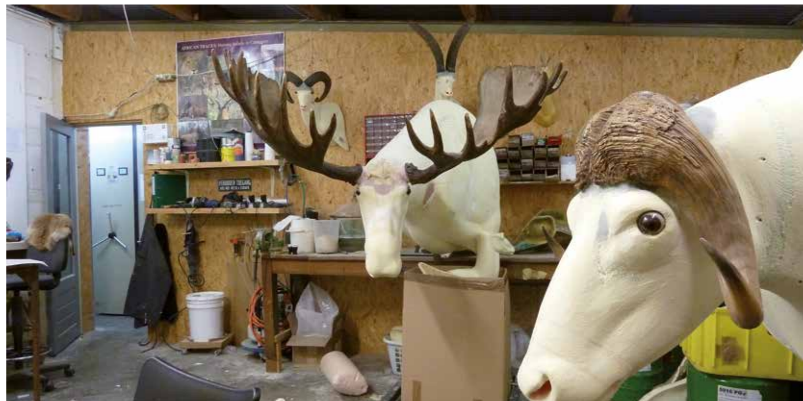
Duif of eland, ieder project blijft interessant.

Omdat ik thuis de oudste was, nam ik logischerwijs het bedrijf over. Dat was in 1988. Al 26 jaar run ik het bedrijf, maar al bijna 60 jaar ben ik met dieren bezig.