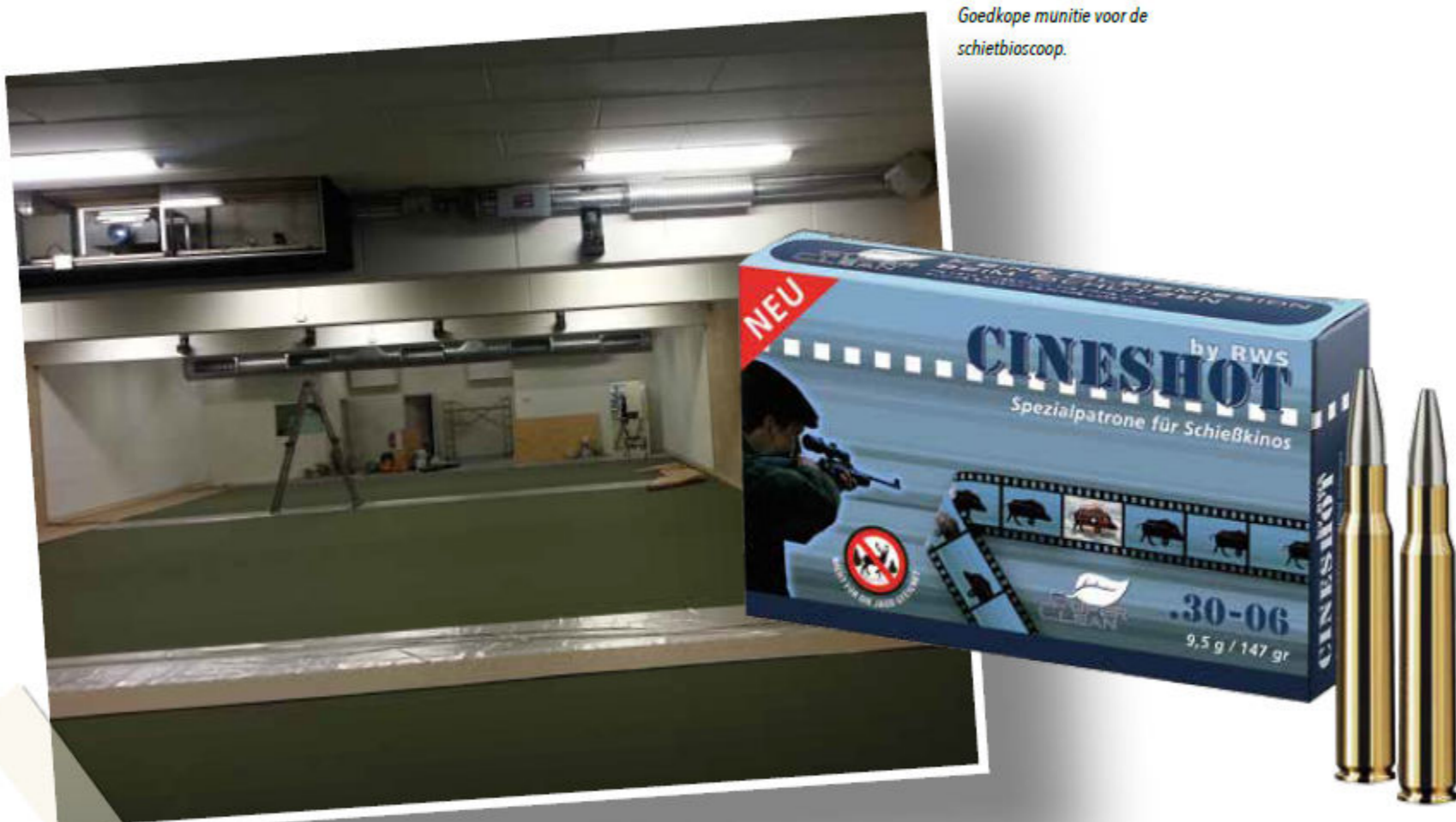
Goedkope munitie voor de schietbioscoop.