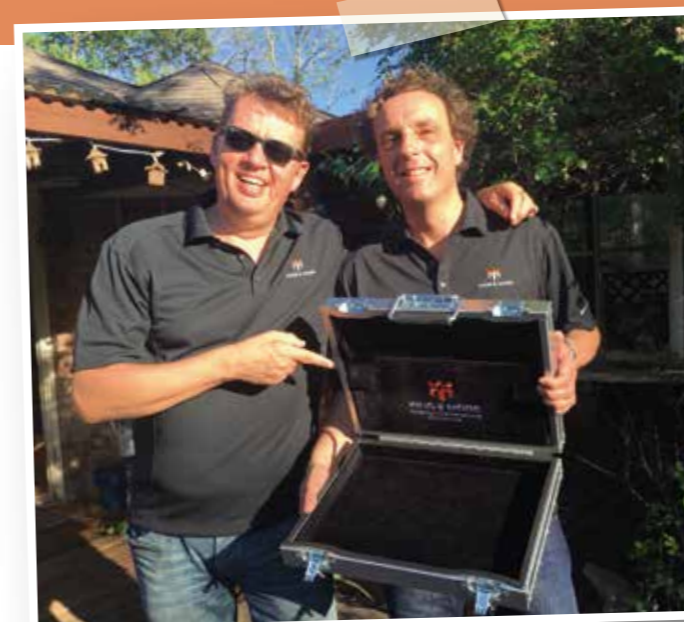
De kisten zijn onder andere te bekijken bij Geweermakerij Elspeek en Jachthuis Leimuiden

King & More maakt meer dan alleen wapenkisten. Voor muziekinstrumenten die de hele wereld overgaan, voor grote computermonitoren met computers voor medische doeleinden.