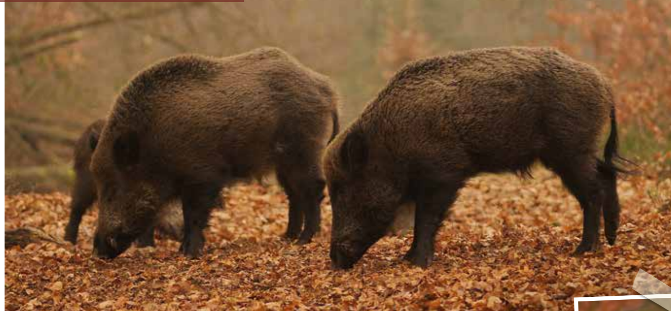
Links een jonge keiler van 3 jaar en rechts keiler 5 jaar